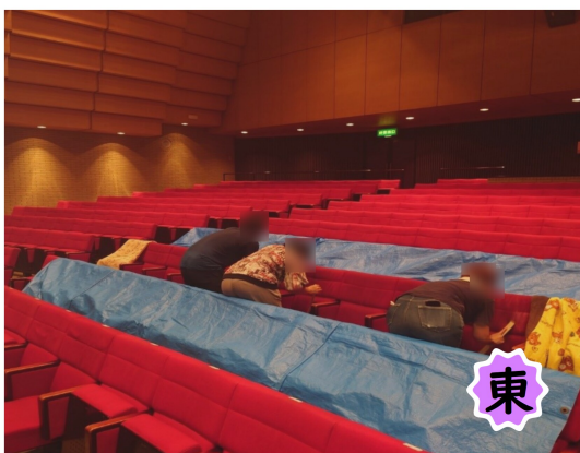
▲熊谷市立文化センター文化会館様

次回は8月の開催を予定しています。「こういうケースではどうしてるの?」「こうしたんだけど合ってたかな?」というような具体的なエピソードをもとに意見交換がなされるよう、少しでも支援機関の皆さんのお役に立てるよう、これからも継続して取り組んでゆきたいと考えています。