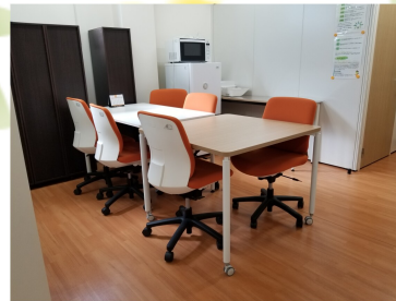
リレーションシップセンター久喜内面談室

A 当センター内には、久喜市障がい者就労支援センター(運営:社会福祉法人啓和会様)のサテライトオフィスがあります。新規相談やお仕事帰りの相談など利用いただいています。また、近隣の就労支援機関や相談支援事業所、