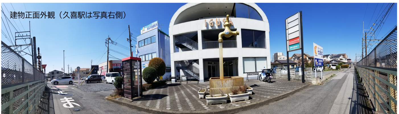
建物正面外観(久喜駅は写真右側)