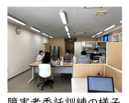
障害者委託訓練の様子

障害者職業能力開発訓練 知識・技能習得コース (障害者委託訓練)(埼玉県から受託) 7月5日~9月3日と10月1日~11月30日の2回、障害者職業能力開発訓練 知識・技能習得コースを実施しました。7名の方が受講され、それぞれ2か月の訓練期間を経て無事に修了されていきました。この後の就職がうまくいくことを願うばかりです。