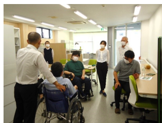
参加した職員も 真剣に取り組みました

就労支援の現場で直接介護をする場面はあまりありませんが、対象者の安全配慮としてこういったことに気を配るべきか、ということを考えるきっかけになったと思います。今回は車いすの操作や移乗体験も行いましたが、一つ一つの行動を対象者と言葉で確認しながら行う過程は、就労支援においても必要なコミュニケーションスキルと感じました。