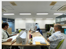
委託訓練の様子 (グループワーク)