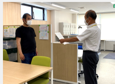
委託訓練修了式の様子