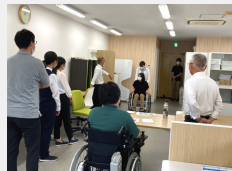
研修会・勉強会等も 行っています。